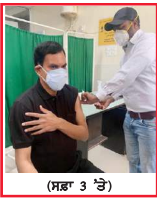
(ਸਫ਼ਾ 3 'ਤੇ)