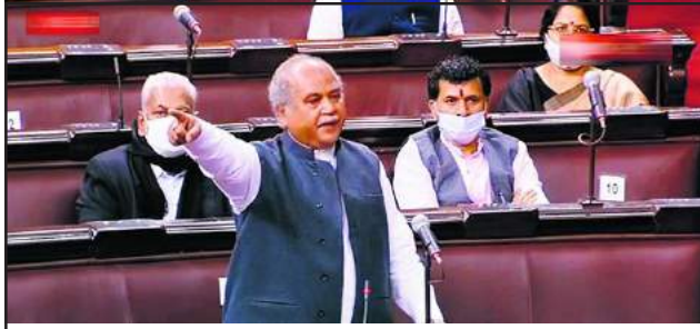
ਖੇਤੀਬਾੜੀ ਮੰਤਰੀ ਨਰੇਂਦਰ ਸਿੰਘ ਤੋਮਰ ਰਾਜ ਸਭਾ ਵਿੱਚ ਸੰਬੰਧਨ ਕਰਦੇ ਹੋਏ।

ਨਵੀਂ ਦਿੱਲੀ, 5 ਫਰਵਰੀ -ਨਿਊਜ਼ਲਾਈਨ ਐਕਸਪ੍ਰੈਸ ਬਿਊਰੋ- ਤਿੰਨ ਖੇਤੀ ਕਾਨੂੰਨਾਂ ਦੀ ਜ਼ੋਰਦਾਰ ਵਕਾਲਤ ਕਰਦਿਆਂ ਕੇਂਦਰੀ ਖੇਤੀ ਮੰਤਰੀ ਨਰੇਂਦਰ ਸਿੰਘ ਤੋਮਰ ਨੇ ਅੱਜ ਕਿਹਾ ਕਿ ਸਰਕਾਰ ਵੱਲੋਂ ਕਿਸਾਨਾਂ ਦੀਆਂ ਭਾਵਨਾਵਾਂ ਨੂੰ ਦੇਖਦਿਆਂ ਇਨ੍ਹਾਂ 'ਚ ਸੋਧ ਦੀ ਪੇਸ਼ਕਸ਼ ਦਾ ਮਤਲਬ ਇਹ ਨਹੀਂ ਕਿ ਕਾਨੂੰਨਾਂ 'ਚ ਕੋਈ ਖਾਮੀ ਹੈ। ਉਨ੍ਹਾਂ ਕਿਹਾ ਕਿ ਅੰਦੋਲਨ ਕਰ ਰਹੀਆਂ ਕਿਸਾਨ ਜਥੇਬੰਦੀਆਂ ਜਾਂ ਉਨ੍ਹਾਂ ਦੇ ਹਮਦਰਦੀ ਅਜੇ ਤੱਕ ਇਨ੍ਹਾਂ ਕਾਨੂੰਨਾਂ ਵਿੱਚ ਇਕ ਵੀ ਖਾਮੀ ਨੂੰ ਲੱਭਣ ਵਿੱਚ ਨਾਕਾਮ ਰਹੇ ਹਨ। ਰਾਜ ਸਭਾ ਵਿੱਚ ਅੱਜ ਰਾਸ਼ਟਰਪਤੀ ਦੇ ਭਾਸ਼ਣ 'ਤੇ ਪੰਨਵਾਰ ਮਤੇ ਦੌਰਾਨ ਹੋਈ ਬਹਿਸ ਦੌਰਾਨ ਉਨ੍ਹਾਂ ਕਿਹਾ ਕਿ ਖੇਤੀ ਕਾਨੂੰਨਾਂ ਦਾ ਵਿਰੋਧ ਸਿਰਫ ਇਕ ਸੂਬੇ ਤੱਕ ਸੀਮਤ ਹੈ ਅਤੇ ਕਿਸਾਨਾਂ ਨੂੰ ਕਾਨੂੰਨਾਂ ਖਲਿਫ ਭੜਕਾਇਆ ਜਾ ਰਿਹਾ ਹੈ।