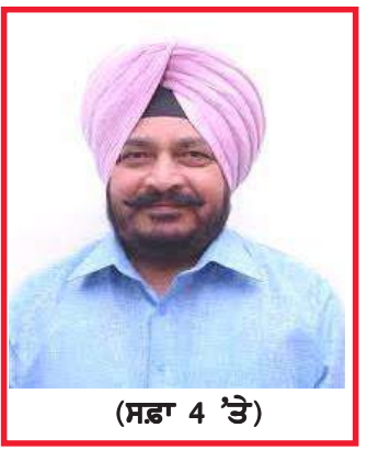
(ਸਫ਼ਾ 4 'ਤੇ)