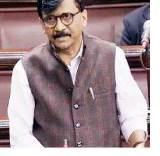
ਜਾ ਰਿਹਾ ਹੈ। ਉਨ੍ਹਾਂ ਕਿਹਾ ਕਿ ਕਿਸਾਨ ਜਦੋਂ ਮੁਗਲਾਂ ਤੇ ਅੰਗਰੇਜ਼ਾਂ ਖਲਿਫ ਲੜਦੇ ਸਨ ਤਾਂ ਉਨ੍ਹਾਂ ਨੂੰ 'ਯੋਧਿਆਂ' ਵਜੋਂ (ਬਾਕੀ ਸਫ਼ਾ 3 'ਤੇ)

ਨਵੀਂ ਦਿੱਲੀ, 5 ਫਰਵਰੀ -ਨਿਊਜ਼ਲਾਈਨ ਐਕਸਪ੍ਰੈਸ ਬਿਊਰੋ- ਸ਼ਿਵ ਸੈਨਾ ਦੇ ਸੰਸਦ ਮੈਂਬਰ ਸੰਜੇ ਰਾਊਤ ਨੇ ਅੱਜ ਸਰਕਾਰ ਦੀ ਆਲੋਚਨਾ ਕਰਦਿਆਂ ਕਿਹਾ ਕਿ ਜੋ ਕੋਈ ਵੀ ਸੱਚ ਬੋਲਦਾ ਹੈ ਉਸ 'ਤੇ ਗੱਦਾਰ ਜਾਂ ਦੇਸ਼ ਧੋਰੀ ਦਾ ਠੱਪਾ ਲਗਾ ਦਿੱਤਾ ਜਾਂਦਾ ਹੈ ਅਤੇ ਉਸ ਖਲਿਫ ਦੇਸ਼ ਧੋਰੀ ਦਾ ਕੇਸ ਦਰਜ ਕਰ ਦਿੱਤਾ ਜਾਂਦਾ ਹੈ। ਉਹ ਅੱਜ ਰਾਜ ਸਭਾ ਵਿੱਚ ਰਾਸ਼ਟਰਪਤੀ ਦੇ ਭਾਸ਼ਣ ਸਬੰਧੀ ਪੰਨਵਾਰ ਮਤੇ 'ਤੇ ਹੋਈ ਬਹਿਸ ਦੌਰਾਨ ਬੋਲ ਰਹੇ ਸਨ। ਸ੍ਰੀ ਰਾਊਤ ਨੇ ਕਿਹਾ ਕਿ ਆਪਣੇ ਹੱਕਾਂ ਲਈ ਲੜ ਰਹੇ ਕਿਸਾਨਾਂ ਨੂੰ ਦੇਸ਼ ਵਿਰੋਧੀ ਜਾਂ ਖਾਲਿਸਤਾਨੀ ਦੱਸਿਆ