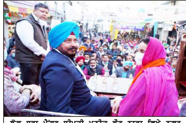
ਲੋਕ ਸਭਾ ਮੈਂਬਰ ਸ਼੍ਰੀਮਤੀ ਪ੍ਰਨੀਤ ਕੌਰ ਨਾਭਾ ਵਿਖੇ ਨਗਰ ਕੌਂਸਲ ਚੋਣਾਂ ਲਈ ਕਾਂਗਰਸ ਪਾਰਟੀ ਦੇ ਉਮੀਦਵਾਰਾਂ ਦੇ ਹੱਕ 'ਚ ਚੋਣ ਪ੍ਰਚਾਰ ਦੌਰਾਨ ਸਾਂਝੀ ਚੋਣ ਰੈਲੀ ਮੌਕੇ ਸ਼ਿਰਕਤ ਕਰਦੇ ਹੋਏ।