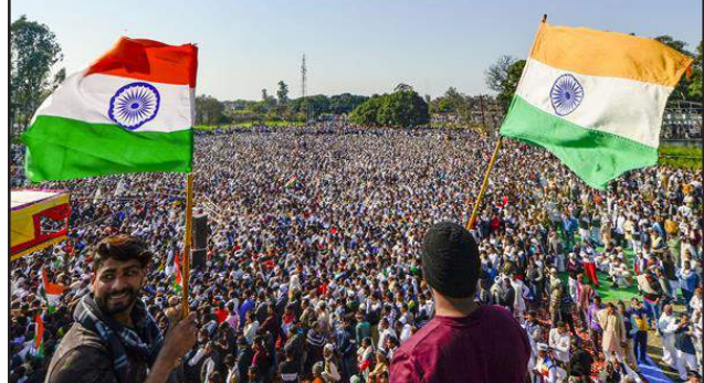
ਬਾਮਲੀ ਵਿੱਚ 'ਮਹਾਪੰਚਾਇਤ' ਦੌਰਾਨ ਲੋਕਾਂ ਦਾ ਠਾਠਾ ਮਾਰਦਾ ਇਕੱਠ

ਨੌਇਡਾ, 5 ਫਰਵਰੀ -ਨਿਊਜ਼ਲਾਈਨ ਐਕਸਪ੍ਰੈਸ ਬਿਊਰੋ- ਪੱਛਮੀ ਉੱਤਰ ਪ੍ਰਦੇਸ਼ ਦੇ ਸ਼ਾਮਲੀ ਜਿਲ੍ਹੇ ਵਿੱਚ ਅੱਜ ਕੇਂਦਰ ਸਰਕਾਰ ਦੇ ਖੇਤੀ ਕਾਨੂੰਨਾਂ ਖਲਿਫ ਹਜ਼ਾਰਾਂ ਕਿਸਾਨਾਂ ਦਾ ਇਕੱਠ ਹੋਇਆ। ਸ਼ਾਮਲੀ ਤੇ ਨੇੜਲੇ ਜਿਲ੍ਹਿਆਂ ਤੋਂ ਹਜ਼ਾਰਾਂ ਲੋਕ ਟਰੈਕਟਰਾਂ, ਦੁਪਹੀਆ ਅਤੇ ਹੋਰ ਵਾਹਨਾਂ 'ਤੇ ਭੱਜਵਾਲ ਪਿੰਡ ਪਹੁੰਚੇ। ਰਾਸ਼ਟਰੀ ਲੋਕ ਦਲ ਵੱਲੋਂ ਲਾਈ ਗਈ 'ਕਿਸਾਨ ਪੰਚਾਇਤ' ਵਿੱਚ ਕਈ ਲੋਕ ਪੈਦਲ ਵੀ ਸ਼ਿਰਕਤ ਕਰਨ ਲਈ ਪਹੁੰਚੇ। ਦੱਸਣਯੋਗ ਹੈ ਕਿ ਇਸ ਇਕੱਠ ਲਈ ਸ਼ਾਮਲੀ ਪ੍ਰਸ਼ਾਸਨ ਨੇ ਇਜਾਜ਼ਤ ਦੇਣ ਤੋਂ (ਬਾਕੀ ਸਫ਼ਾ 3 'ਤੇ)